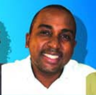
Kenneth Customer Care Agent